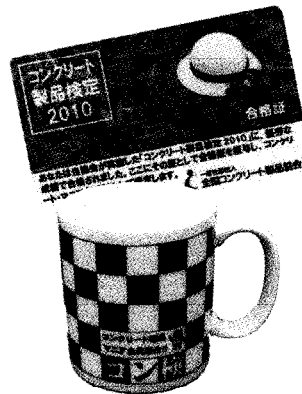
カードと記念品(2010年の例)

初めてコンクリート製品検定を受験される一般の方や学生・生徒、コンクリート製品メーカーの取引先、金融機関、コンクリート製品メーカーの社員など、すべての方が対象で、コンクリート製品に関する知って得する豆知識、社会的価値などの基礎知識を中心に学んでいただく検定です。